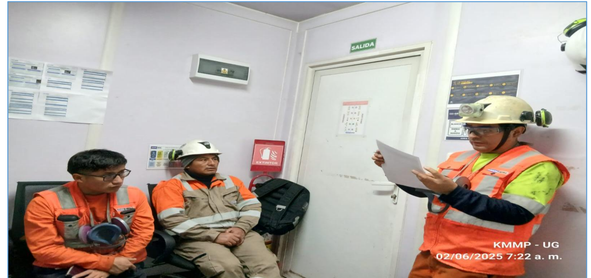
KMMP - UG 02/06/2025 7:22 a. m.