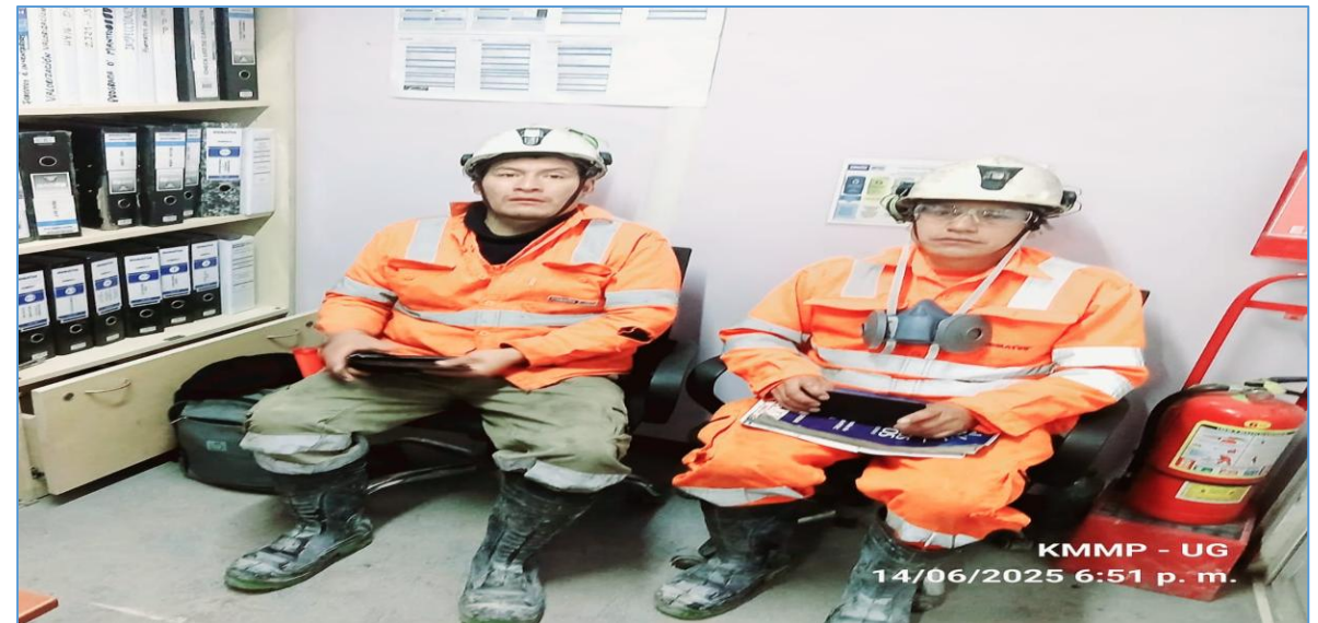
KMMP - UG 14/06/2025 6:51 p. m.